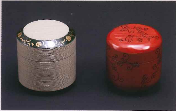
見通良片木目雪吹 酢漿草唐草片木目中棗