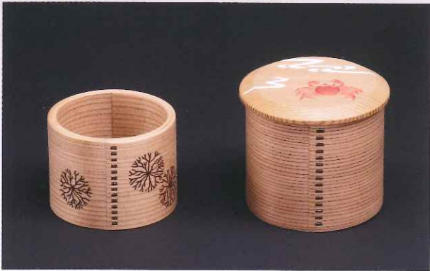
海松絵曲蓋置 蟹置上曲茶器