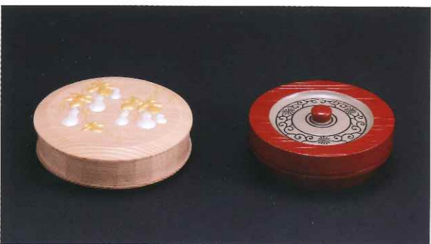
六瓢置上折撓香合 唐松唐草絵片木目独楽香合