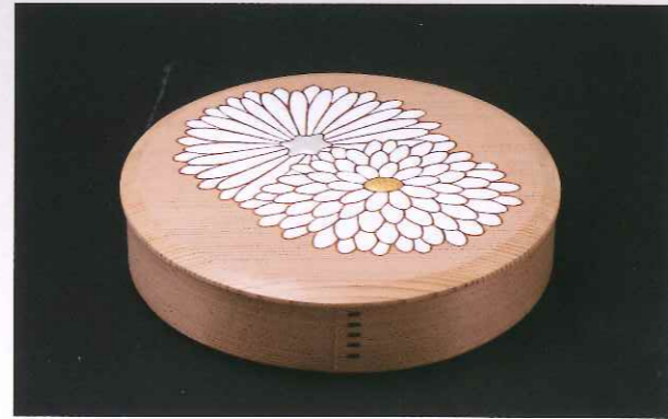
菊置上陰陽曲碗箱