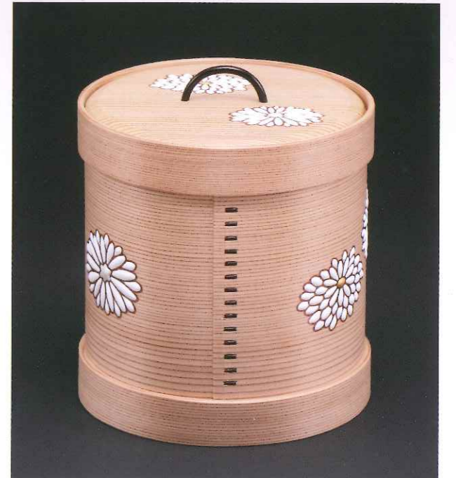
菊置上曲水指 (小型)

写真掲載の作品をはじめ多数の作品を一堂に展覧致します。4階展示場にて呈茶を致します。どうぞごゆるりとお寛ぎくださいませ。