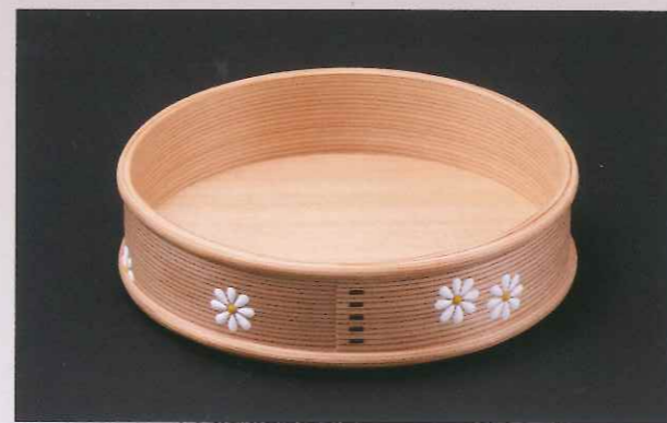
菊置上曲莨盆 (小型)