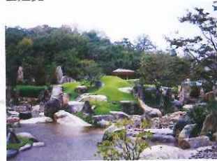
日本庭園內設茶室，不妨靜下來享受一個抹茶set(¥500)。