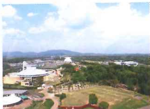
園內範圍極廣，建議乘坐免費穿梭巴士遊覽。