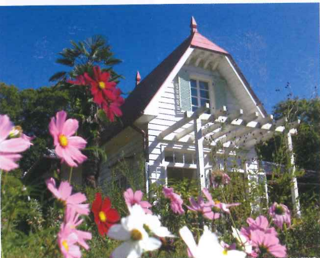
由於網上購票不方便遊客，想參觀草子和次子之家，可選平日即場買票，機會較大。成人¥510，小童¥250。

距離名古屋車程約40分鐘的長久手町，是當年舉行世界博覽會(世博)的所在地。會場現已改建成愛地球博紀念公園，園內兒童遊樂設施眾多，是親子遊必去勝地。