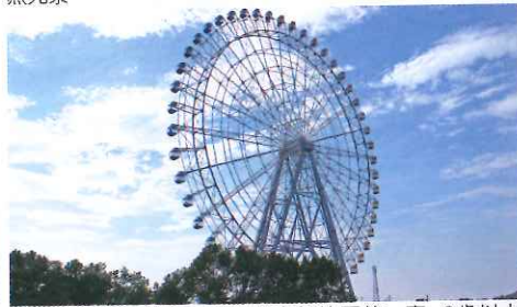
園內地標摩天輪高88米，是中部地區第一高。3歲以上¥600