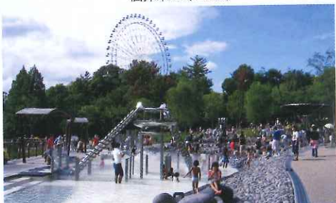
「自然體感遊具」讓小朋友邊玩邊感受樹林、水及風等自然元素。

愛地球博紀念公園前身是2005年世博主場地，世博結束後改建成大型公園，貫徹愛地球博的環保概念，部分博覽會設施得到保留並改成市民日常用途。園內設有大量兒童遊樂設施，每逢假日不少日本人都帶小朋友來「放電」。另一注目景點是重現人氣動畫《龍貓》主角所住的小屋「草子和次子之家」(サツキとメイの家)，採用預約參觀制，限時30分鐘，可事前於網上或即場購票(由0830開售)，但名額有限，非常搶手，最好提早準備。