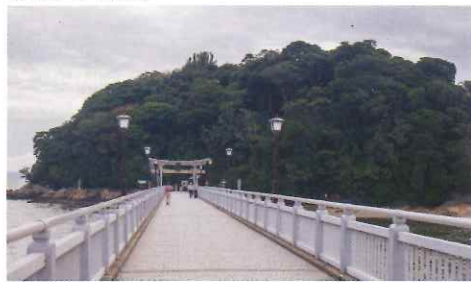
竹島橋全長387米，走在上面，颯颯風聲與身擦過。

i 愛知縣蒲郡市竹島町3-15 ☎ +81-533-68-3700(神社社務所) 🕒 24小時 🛌 無休息日 🌐 www.yaotomi.net