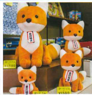
可愛的狐狸公仔，各種大小任君選擇，¥1,000起。