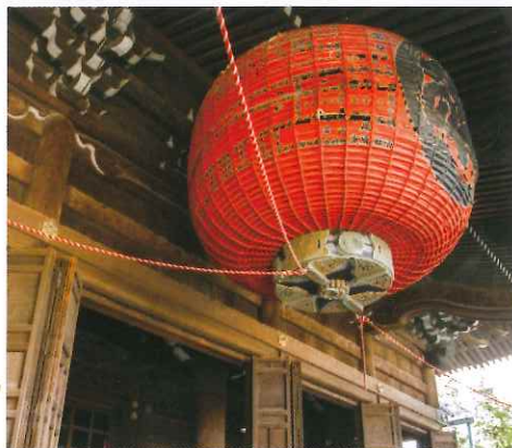
本殿花上廿年建造，高約31米，天花掛著一個大燈籠，氣勢雄偉。