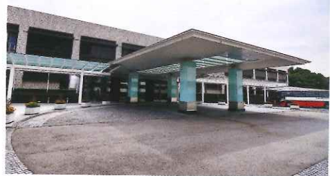
豐田會館的正門入口。

豐田會館是全世界最大車廠的主要展示中心，館內入口就是博物館(トヨタ会館ミュージアム)，可一睹豐田汽車的最新科技發展、環保汽車的開發過程，當然還有最新款的豐田汽車任坐任摸。另外，每日都有多場表演及示範，包括在05年地球博中極受歡迎的機械人音樂表演，及未來概念車的真車操作介紹等，汽車迷必到。