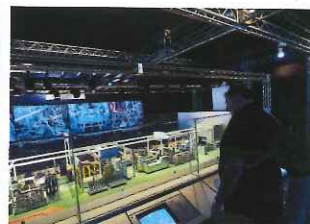
以互動模型簡單介紹汽車在工場內的製作流程。