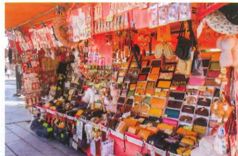
入口處不時有本地居民擺攤，販賣各種紀念品。