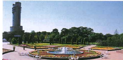
植物園區有一個用了3萬株鮮花組成的大花壇，一年5次按不同季節換上不同的花種，令人賞心悅目，是拍照留念的好地方。