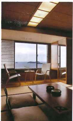
望海和室利用窗口採光，加上室內的天然木設計，十分愜意舒適。

入住溫泉旅館的終極目的還是希望休養生息，回復元氣。能眺望三河灣的Hotel明山莊，客房分為望海和附設露天風呂兩種，前者室內裝潢利用大量天然木材及自然光，令住客入屋一刻頓感豁然開朗。大浴場設露天風呂等共7種溫泉，並有碳酸風呂及天然遠赤外線桑拿。2個溫泉均能有效消除疲勞、改善神經痛、關節痛等毛病，而溫泉接待處提供的7種健康茶，如甜茶、黑豆茶、黃薑茶，均用納米水沖製而成，非常滋補。