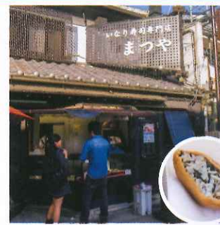
豐川稻荷壽司其實就是腐皮壽司，通常一盒數個，這間まつや就接受散買，圖中為五目口味，¥120/個。