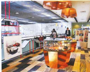
2樓設有咖啡室及紀念品店，售賣不少豐田獨家精品以及汽車模型等。