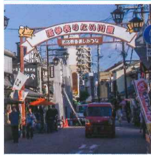
豐川稻荷壽司於多間食店有售，總門對面的門前そば山彥最顯眼。