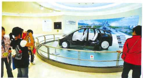
可以見到多部尚未推出市場的未來概念車。