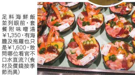
足料海鮮飯並列眼前，套餐附味噌湯¥1,350，有海膽及拖羅也只是¥1,600，敢問哪位看官不口水直流？(食材及價錢按季節而異)