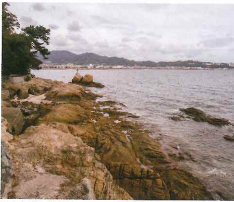
竹島盡頭回望對岸，又是另一番景象。