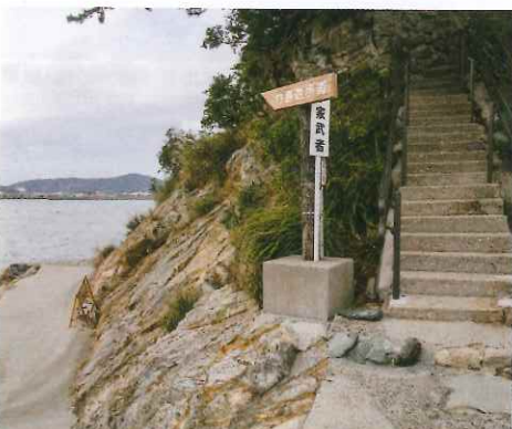
環島路徑全長約680米，途經八處，稱為「竹島八景」。