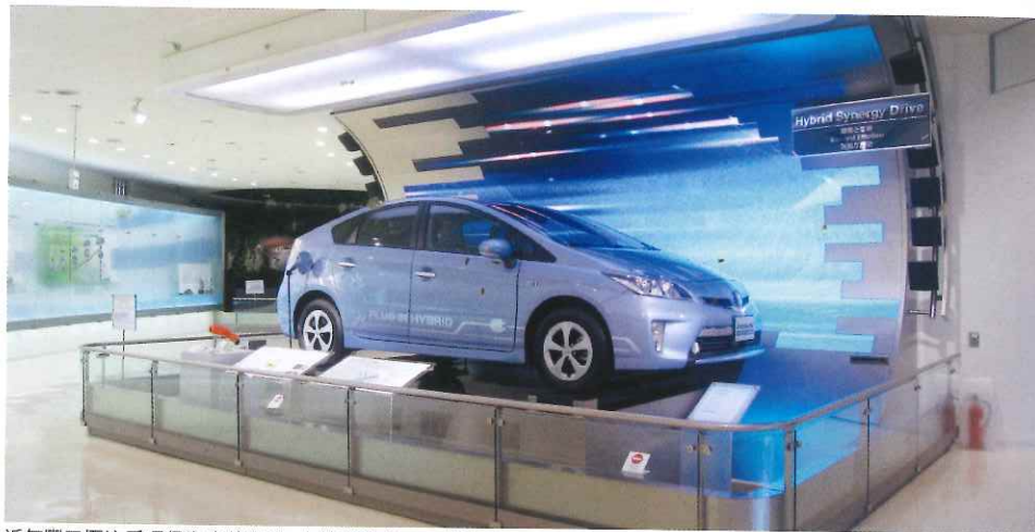
近年豐田極注重環保汽車的開發，在博物館的入口就詳盡介紹環保汽車的構造及對環境保護的貢獻。

地址 愛知縣豐田市トヨタ町1番地 電話 +81-56-529-3355(工場見學預約) 時間 0930-1700(工場見學只開放週一至五參觀) 休息 周日及公司連休(黃金週、年末年始等) 網址 www.toyota.co.jp/jp/about_toyota/facility/toyota_kaikan/index.html