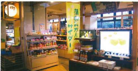
明山莊商店售賣蒲郡特產，如最有人氣的蒲郡橙燒餅等，營業時間 0700-1100, 1500-2100。