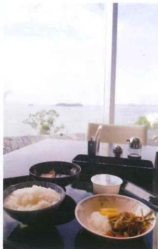
在 Restaurant 菴宮能邊吃早餐邊享受三河灣絕景。