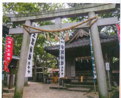
島中心5間神社各自供奉健康、從商、除厄之神等，不同願望都能滿足。