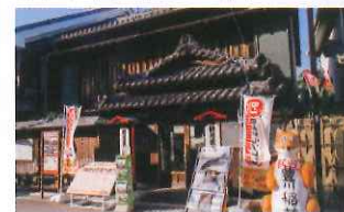
豐川市觀光案內所位於近車站一端。

豐川稻荷表參道泛指寺院前至車站一帶的商店街，聚集超過100間形形色色的餐廳和商店，景觀洋溢懷舊風情。不少人參拜後，都會到餐廳吃兩大當地名物：精進鰻鮓（類似烏冬冷麵）和豐川稻荷壽司，為豐川開運之旅畫上完美句號。