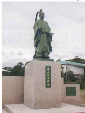
橋頭的雕像人物，是開發蒲郡的功臣藤原俊成。

竹島樸實優美的環境，曾啟發不少文人的創作靈感，日本首位諾貝爾文學獎得主川端康成亦對竹島有特別的情意結。岸上有間文學紀念館，展出各名作家描寫有關竹島和蒲郡的作品，值得一到。