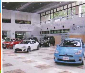
汽車展場展出多部現時豐田在全世界熱賣中的新車，部分尚未引入香港。