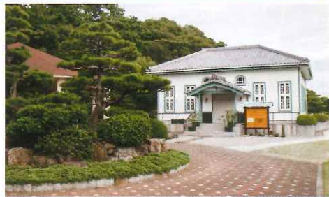
海辺の文学記念館特設「未來信件」服務，可指定5或10年後寄出，非常特別。