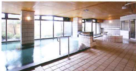
大浴場可眺望庭園，連同露天風呂在內共有7種溫泉，好讓你浸個夠！