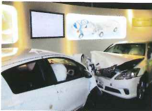
汽車安全示範亦很值得觀看。