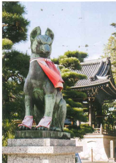
豐川稻荷是佛教寺院，不是道教神社，但與其他稻荷神社一樣，佈滿狐狸的身影。