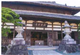
本堂內供奉著本尊的千手觀音像。

佔地超過10萬平方米的境內，有90座大大小小的伽藍寺廟，其中以本殿和山門最有看點，後者是境內最古老的建築，於1536年由今川義元奉獻而設。