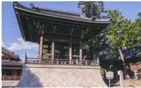
近入口處的鐘樓堂，每日早晚敲鐘兩次，鐘聲方圓4公里內都可聽到。