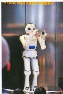
當然還有豐田引以為傲的音樂機械人表演。