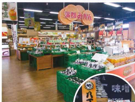
一樓的Vege Cut主打東三河產新鮮蔬菜，另有其他地方名產，如同崎的八丁味噌。

最值得一提的是，LAGUNASIA每年都會跟人氣動漫合作舉行限期活動，例如過往就有NARUTO及ONE PIECE角色展覽，園內隨處可見人物塑像，粉絲必到！注意出發前要到官網查閱最新合作活動。