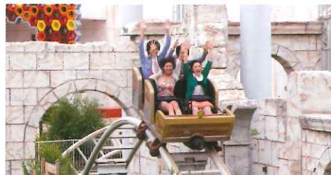
這款「アクア ウィンド」過山車看起來迷你，但急速墮下和拐彎，依然惹來陣陣尖叫聲。