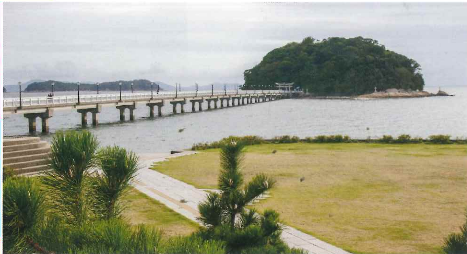
竹島與岸邊以竹島橋連接，每年4至6月潮退時，吸引大批遊人挖貝。