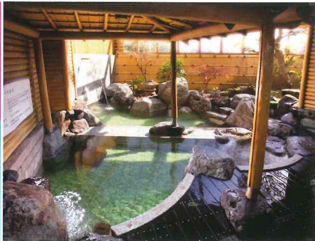
明山莊的溫泉又稱「美白泉」，此露天風呂為單純弱放射能溫泉，有助舒緩神經、肌肉及關節痛。