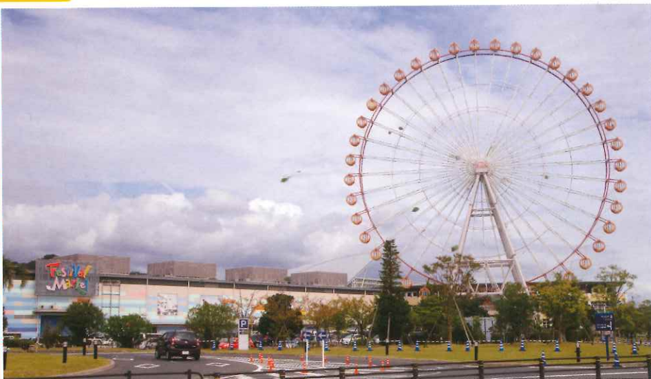
近年LAGUNA積極與人氣動漫合作搞限定活動，吸引力大增。