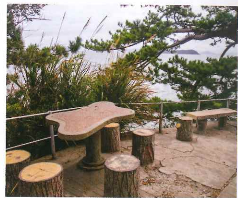
八景之一的「菴神岬」，可遠眺三河大島，該處每逢夏天都會變身人氣嬉水地。