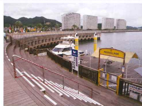
想遊船河，可到商場前的船泊處報名參加，約1小時一班，有20至40分鐘路線可選。