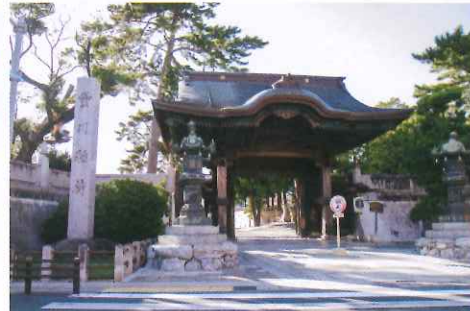
別以為這道總門平平無奇，其實由品種稀有的千年木材打造而成。