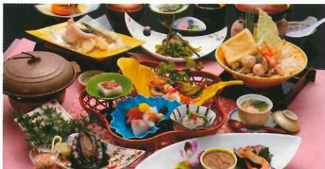
鮑付會席膳，有陶板鮑魚、鯖魚、烏賊等美食，記得吃前多浸一盞溫泉，跟足日本人「一日三浸」的傳統！