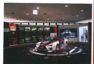
豐田是賽車常客，這輛就曾參加Gazoo Racing。