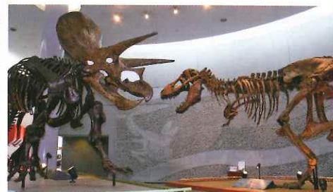
在自然史博物館內展示著暴龍和三角龍的化石標本，令人歎為觀止。

動物園區內的非洲園有斑馬、長頸鹿等動物在內自由行走，大家可近距離觀看其生態。登上展望塔則可飽覽整個園區。