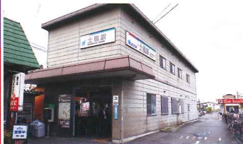
由名古屋出發，最快捷又便宜的方法是乘坐名鐵到土橋站再轉巴士，但留意只於平日運行，周六日休息。

名古屋一帶向來是日本的重工業重鎮，汽車製造業更是當中的龍頭。而規模最大，無論產量及銷量都是世界第一的豐田汽車，大本營就位於名古屋近郊的豐田市內，這裡隨處都可以見到豐田汽車的工場或者是寫字樓、實驗室，名副其實是汽車之城。來到豐田市，重點當然是遊覽豐田汽車的展示館：豐田會館(トヨタ会館)，可近距離觀看各種豐田的最新科技，更可進入汽車製作工場內參觀。