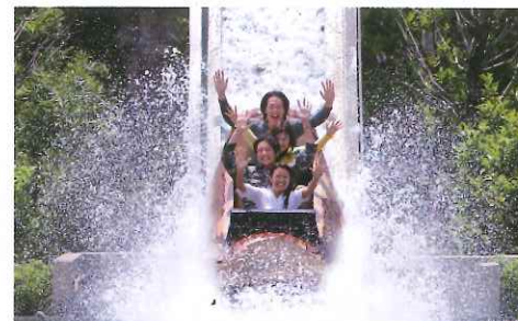
既然來到海港主題樂園，怎能不沾水？Let's get wet!