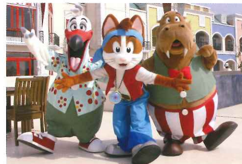
樂園的吉祥物PEATO(左起)、GATO、MORSA及LUNA，每日隨機現身與遊客拍照，開園時段最有機會見到他們。