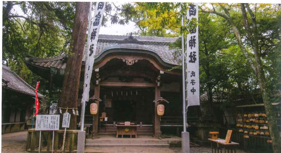
島上神社之首八百富神社，祈求開運、順產和結婚特別靈驗。

i 愛知縣蒲郡市竹島町3-15 ☎ +81-533-68-3700(神社社務所) 🕒 24小時 🛌 無休息日 🌐 www.yaotomi.net