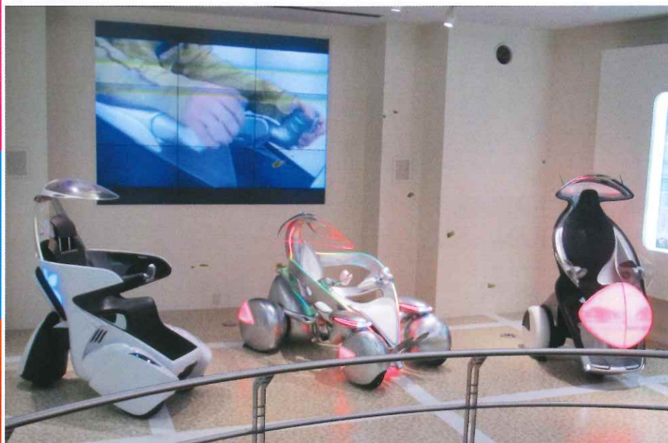
在豐田會館，可以觀看多款尚未推出或無打算推出的豐田概念汽車。