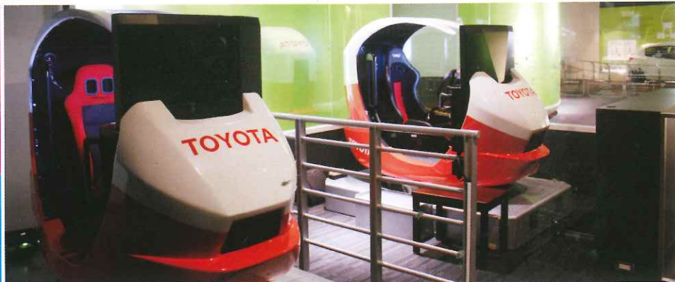
館內可試玩這個為防止交通意外而研發的模擬器。