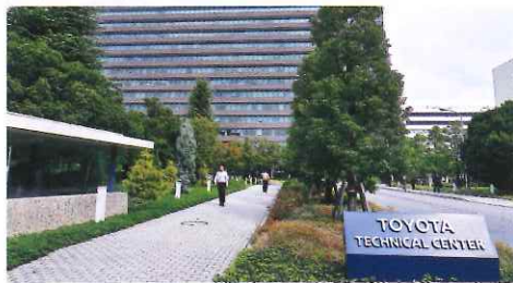
豐榮交通巴士的下車位置是豐田技術中心附近，要穿過隧道再行5分鐘才到達會館正門。

地址 愛知縣豐田市トヨタ町1番地 電話 +81-56-529-3355(工場見學預約) 時間 0930-1700(工場見學只開放週一至五參觀) 休息 周日及公司連休(黃金週、年末年始等) 網址 www.toyota.co.jp/jp/about_toyota/facility/toyota_kaikan/index.html