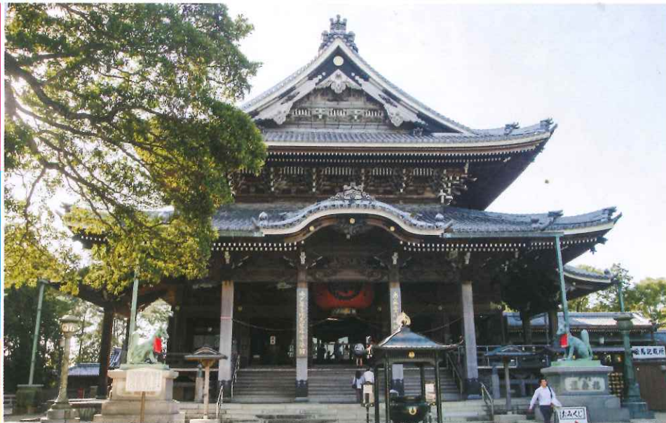
豐川稻荷是日本人參拜的熱點，每逢元旦假期，都要出動警察實行交通管制。