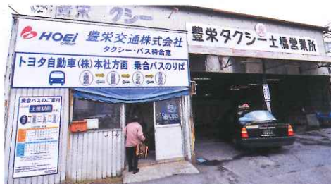
轉乘巴士到會館的巴士站，位於車站斜對面馬路。