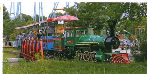
遊樂場區內很受小朋友歡迎のこども汽車。

地 愛知縣豐橋市大岩町字大穴1-238 電 +81-532-41-2185 時 0900-1630(最後入園1600) 休 周一(如遇假期及補假，則翌日休息)、12月29日至1月1日 費 成人¥600、中小學生¥100、3歲以下免費(遊樂場機動遊戲需另收費) 網 www.nonhoi.jp 地 JR「二川」駅南口徒歩約6分鐘。