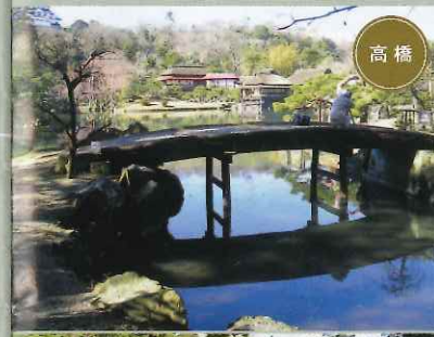
橋の上からも庭を眺めてみよう

江戸時代、榎御殿と呼ばれた彦根藩の下屋敷の庭園が玄宮園(屋敷部分は楽々園)です。井伊家代々が散策を楽しんだ大名庭園の玄宮園で、池泉回遊式庭園の回り方を見てみましょう。