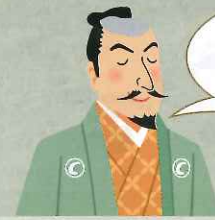
日本の庭園文化は 池泉から 始まったんだよ

People can get lively image from water, so water in Japanese garden give us clean and lively image.