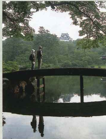
彦根城天守を望む 玄宮園から

Olden days, Japanese people made garden that reproduce nature and four seasons feature. That is Japanese Garden. That kind of Japanese garden is loved by many people. That kind of Japanese garden is still loved by many people.