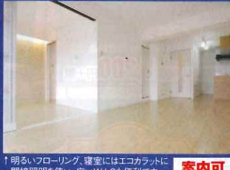
↑明るいフローリング、寝室にはエコカラットに間接照明を使い、広いW.I.Cも便利です 案内可

(株)Uコーポレーション 0586-69-0620 一宮市萩原町高木字味噌屋28 愛知県知事免許(4)第18209号 愛知県知事(敷-28)第50941号 愛知県宅地建物取引業協会会員