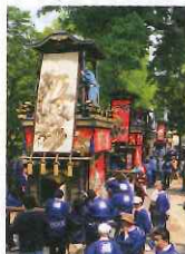
美濃竹鼻まつりは5月3日水祝開催。絢爛豪華な山車が曳き回される。

樹齢300年以上といわれる「竹鼻別院の藤」は、華やかな薄紫の花々を30m以上にわたって広げる県指定天然記念物の藤。まつり期間中、藤棚の下ではお抹茶コーナーや模擬店など、各種イベントが催されるほか、夜には藤棚のライトアップも実施。また、竹鼻まつりの華麗な山車も併せて楽しむことができます。