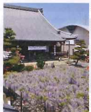
境内に美しい藤棚をもつ竹鼻別院。