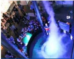
④ 高9米的人工龙卷风