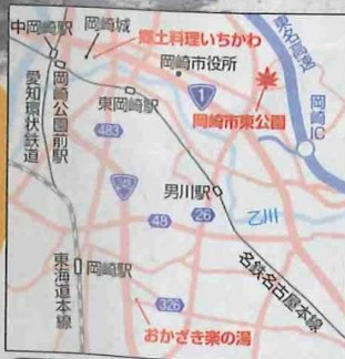
MAP P81 B-2