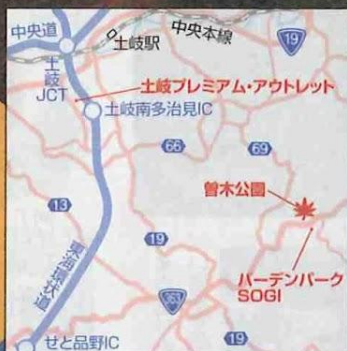
MAP P82 B-5・6