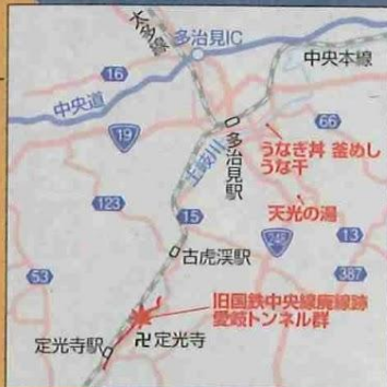
MAP P82 B-5