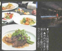
約1,000円押せばま つめる夜景が ラジアンが人気だ

☎052-967-5755 名古屋東区東 横1-13-2 朝11時～23時 休第1・3日 ※地下鉄栄駅4番出口より徒歩3分 ※共用駐車場600台(有料)