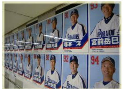
▲ナゴヤドーム前矢田駅から続くドラゴンズロードと呼ばれる地下道。壁には選手紹介やドラゴンズの歴史などがいっぱい！